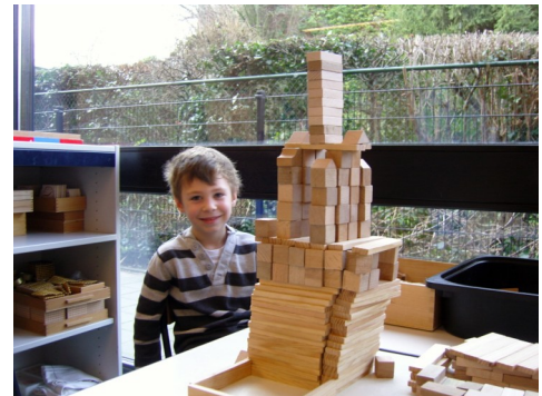
Bouwen in de bouwhoek.