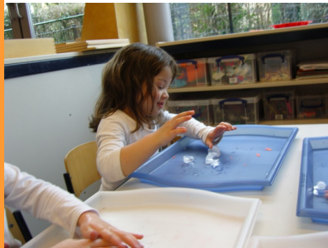
Manipuleren met ijsblokjes.

Speelplezier staat voor samen, volwassenen en kinderen, plezier beleven in spel. Spelen is de meest wezenlijke activiteit van jonge kinderen. Kinderen leren door te manipuleren, te exploreren en door problemen die ze al handelend tegen komen op te lossen. Tevens leren kinderen door anderen te imiteren. Tijdens dat spelen komen ze tot tellen, meten, lezen, schrijven enz.